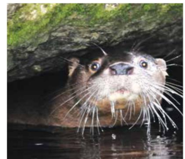
Figura 3. Detalle de la cabeza de huillín

En consecuencia, que todos colaboremos en la difusión y puesta en valor del huillín es una forma de contribuir a su conservación.