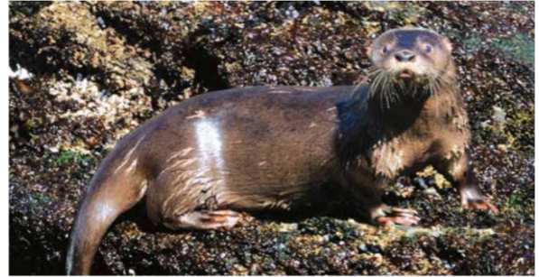
Figura 1. El huillín ( Lontra provocax ) nutria endémica de Patagonia en peligro de extinción

El huillín (Figura 1), es una nutria endémica de Patagonia, que se encuentra entre los depredadores más altos en estos ecosistemas pero son animales muy temerosos por lo que suele ser difícil su avistamiento.