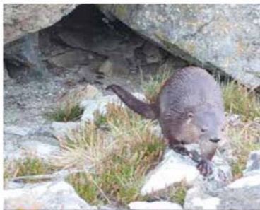
Figura 2. Huillín en el Parque Nacional Tierra del Fuego,

Los adultos miden más de 1 metro de largo, incluyendo la cola de hasta casi medio metro. Pesan entre 6 y 12 kilogramos y los machos son más corpulentos. El pelaje les cubre todo el cuerpo, es aterciopelado, muy tupido y de color marrón oscuro en el lomo aclarándose hacia el vientre.